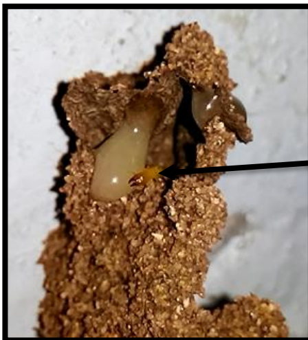
טיפול בפתיונות בתעלות הבוץ שנמצאו