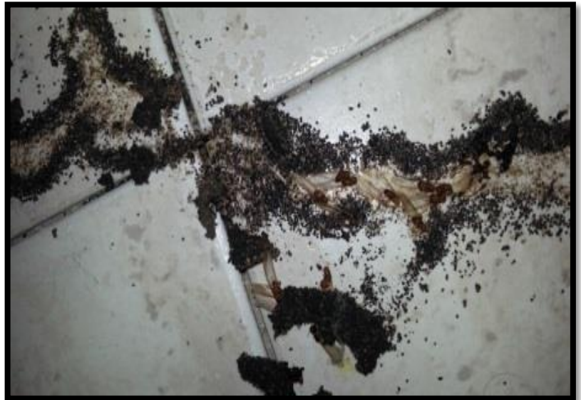
טרמיטים מתים בפתח התעלה שנמצאה